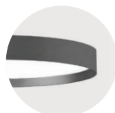
U Urban Graphite U Urban Graphite