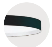
B Jet Black W Snow White