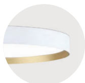
W Snow White G Satin Gold