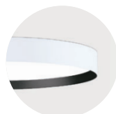
W Snow White B Jet Black