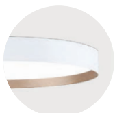
W Snow White K Satin Copper