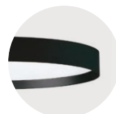
B Jet Black B Jet Black