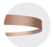
K Satin Copper K Satin Copper