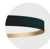
B Jet Black G Satin Gold