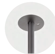
Multisensor / HCL / Swarm Control