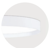
W Snow White W Snow White