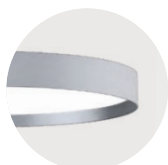
S Radiant Silver S Radiant Silver