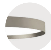
H Anodic Champagne H Anodic Champagne