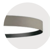
H Anodic Champagne B Jet Black